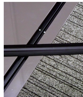
小さな段差でも使用可能