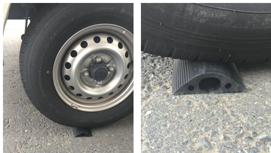
普通車両・台車が通過してもケーブル保護可能！ ※収容ケーブルはキャブタイヤケーブルとし、通過時は徐行して下さい