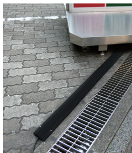
外看板のケーブル保護