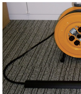
コードリールからのケーブル保護