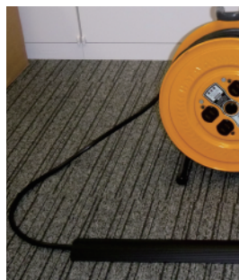
コードリールからのケーブル保護