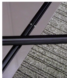
小さな段差でも使用可能