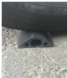
普通車両・台車が通過してもケーブル保護可能！ ※収容ケーブルはキャブタイヤケーブルとし、通過時は徐行して下さい